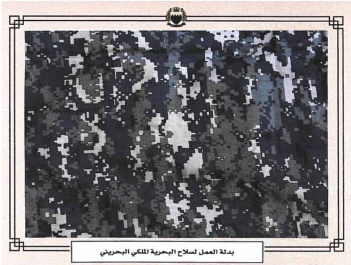
بدلة العمل لتسلاح البحرية الملكي البحريني